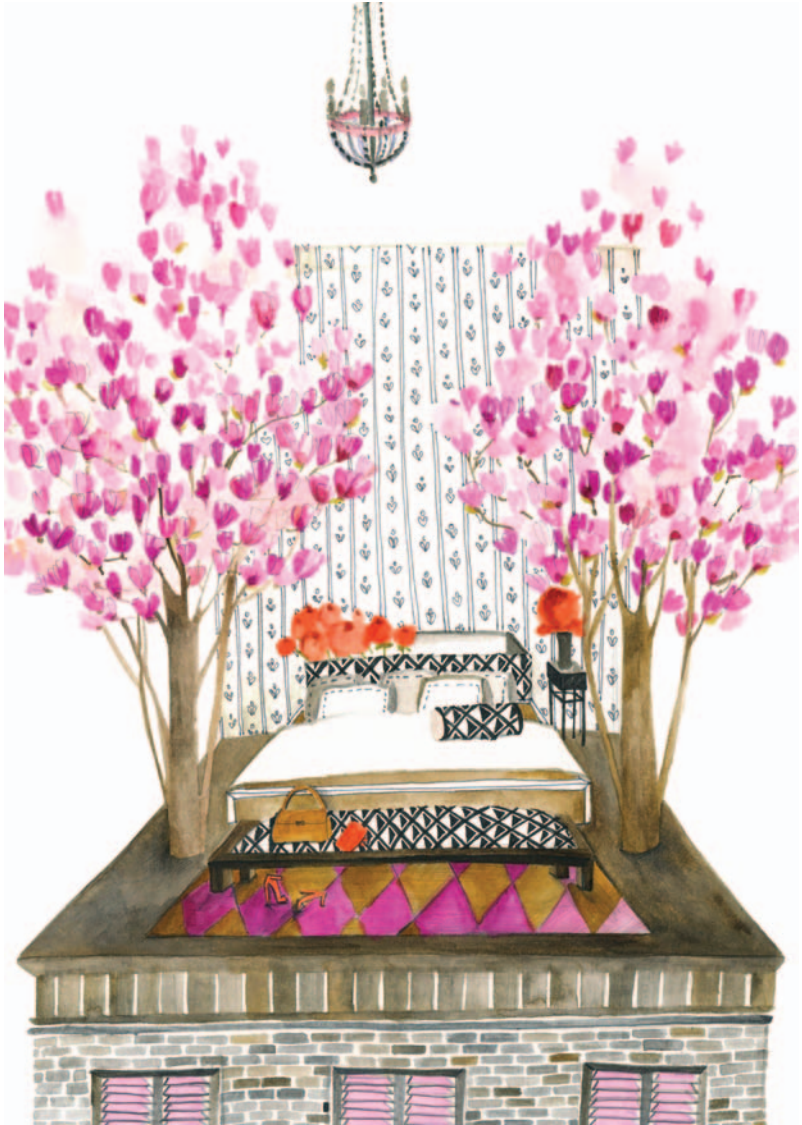
Un loc pentru o magnolie