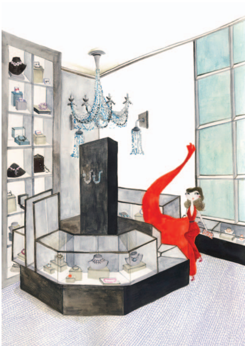
Elefantul în magazinul de cristaluri