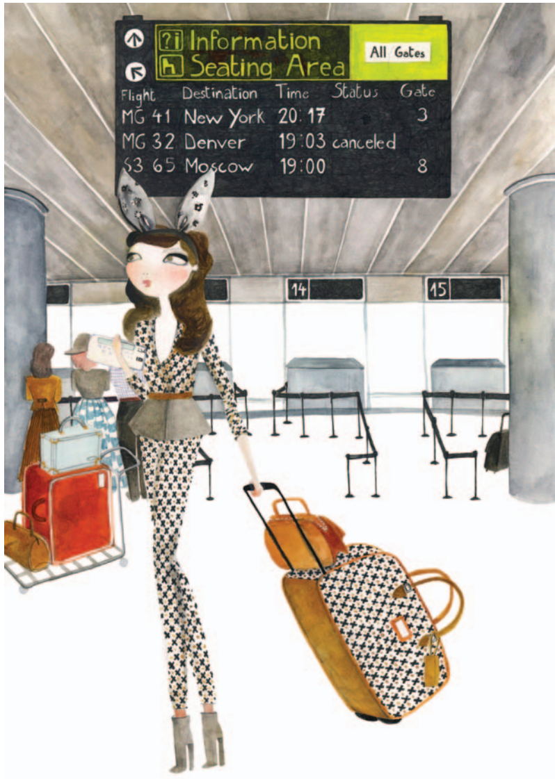
Femeile aproape perfecte și ridicolul eliberator