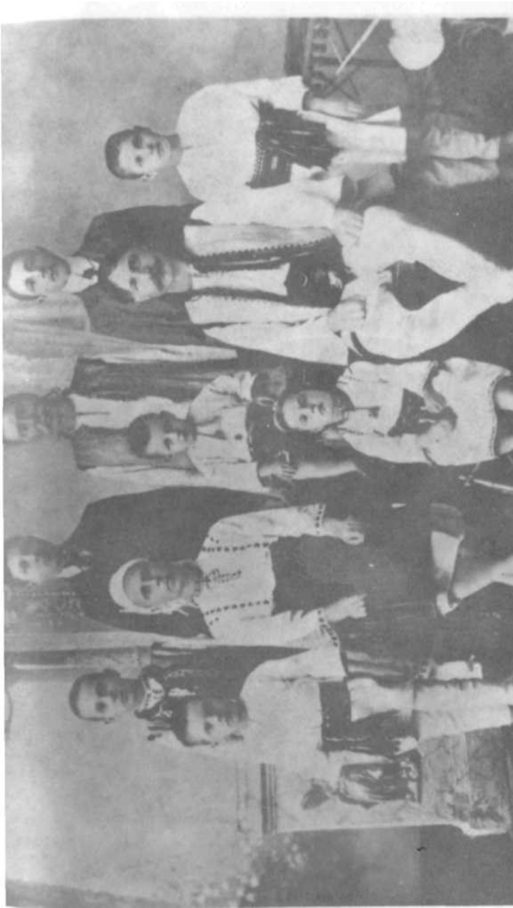
stolovoia (rs.) - cantină

Aciastă dragoste și iubire de familie ni-a dat putere în toate greutățile și am putut rezista și ni-am salvat viața.