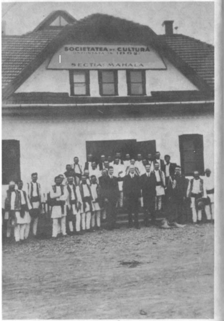
Casa Națională din Mahala, in 1937.