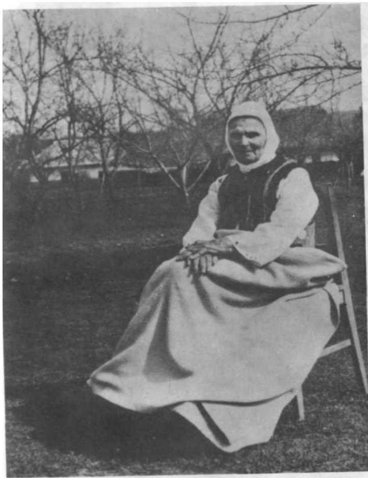
Mama Aniței, în 1940.