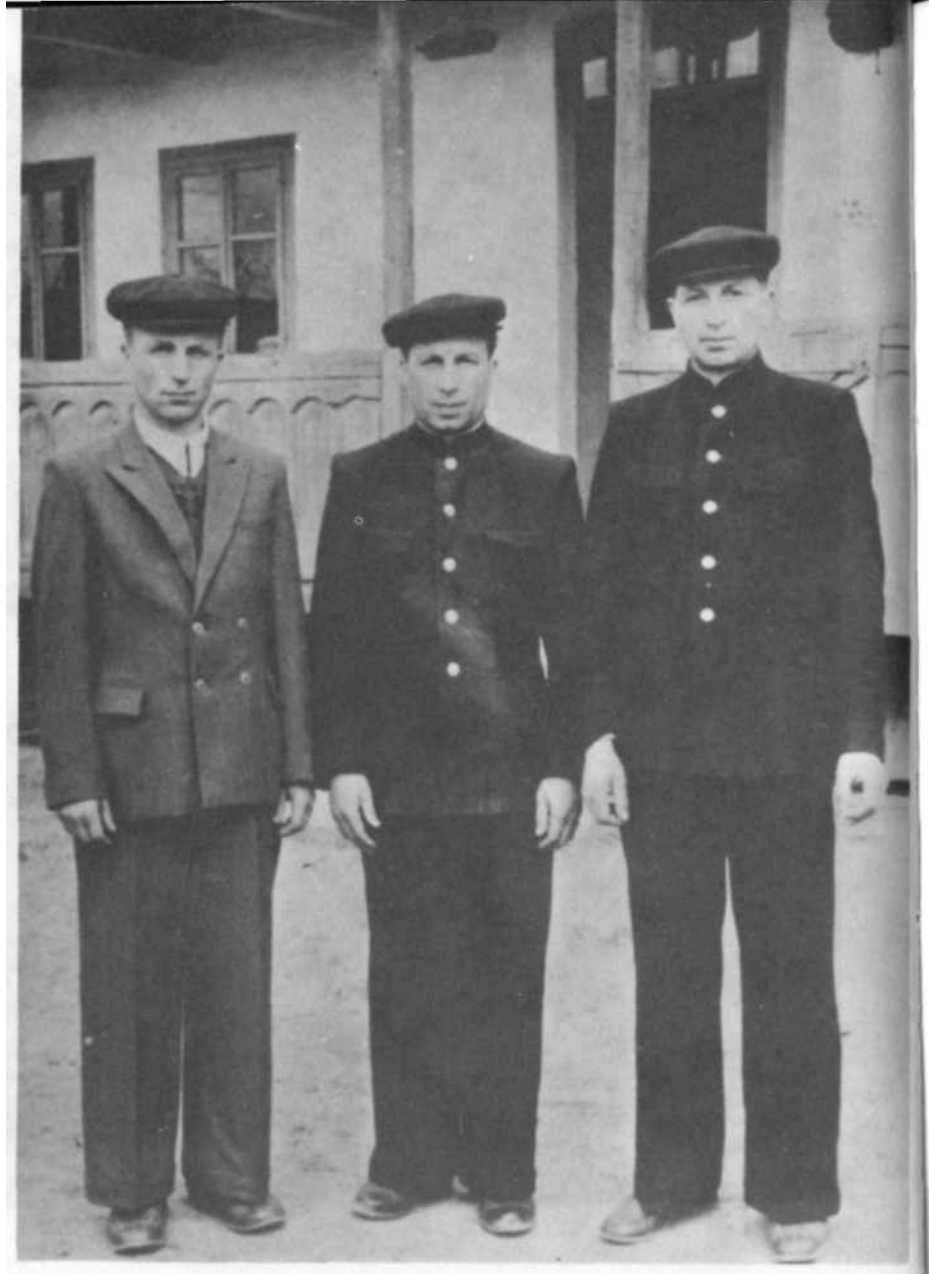
Cei trei frați reîntorși în satul românesc Mahala, în fața casei lor, după 20 de ani de surghiun în Siberia. Anul 1960.