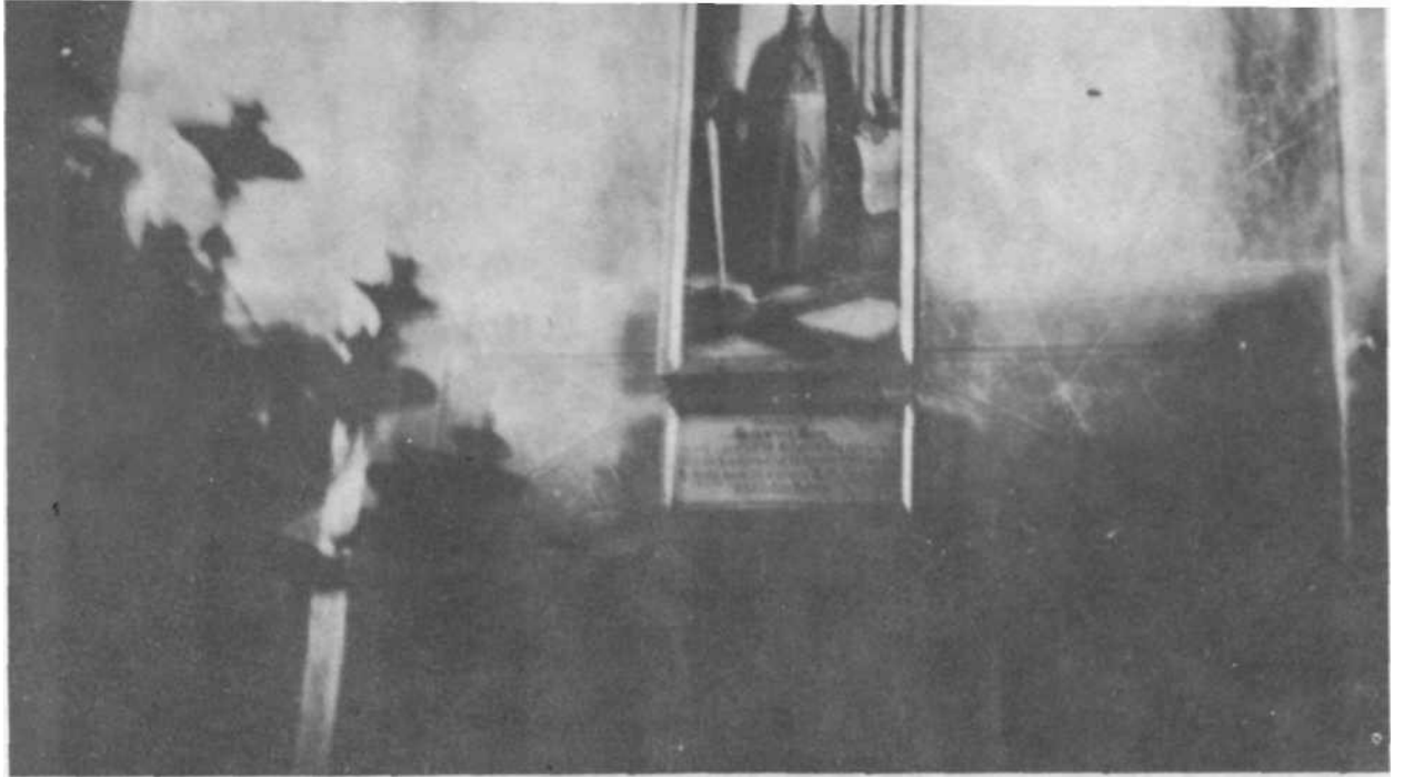
Icoana lui Ștefan cel Mare din biserica satului Mahala.