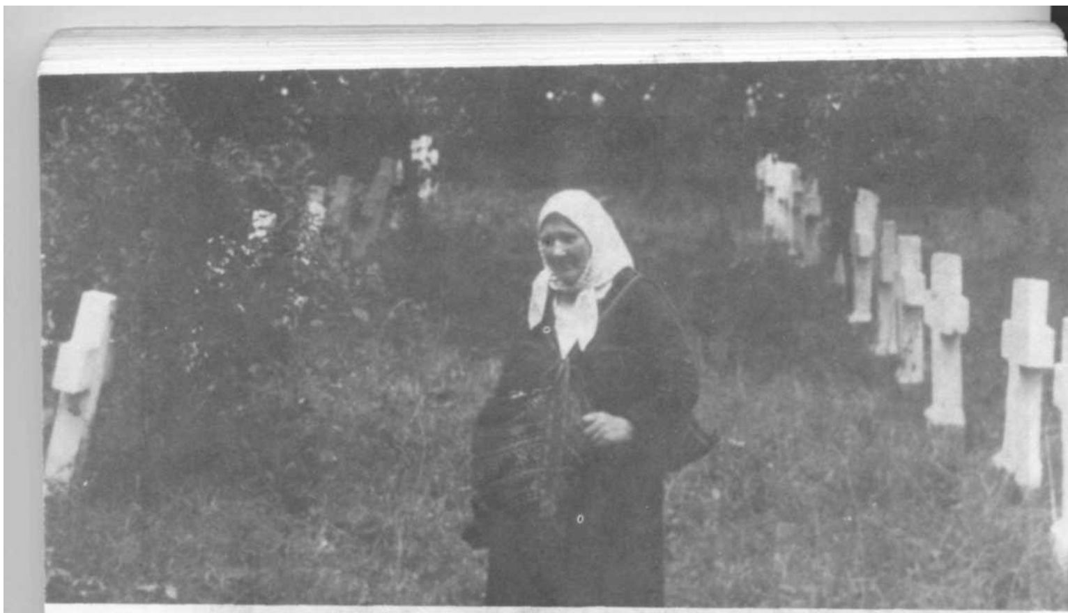
Cimitirul satului Mahala, 1941. Șirurile de cruci pomenesc pe cei ce au încercat să treacă frontiera spre România și au fost omoriți de grănicerii sovietici.