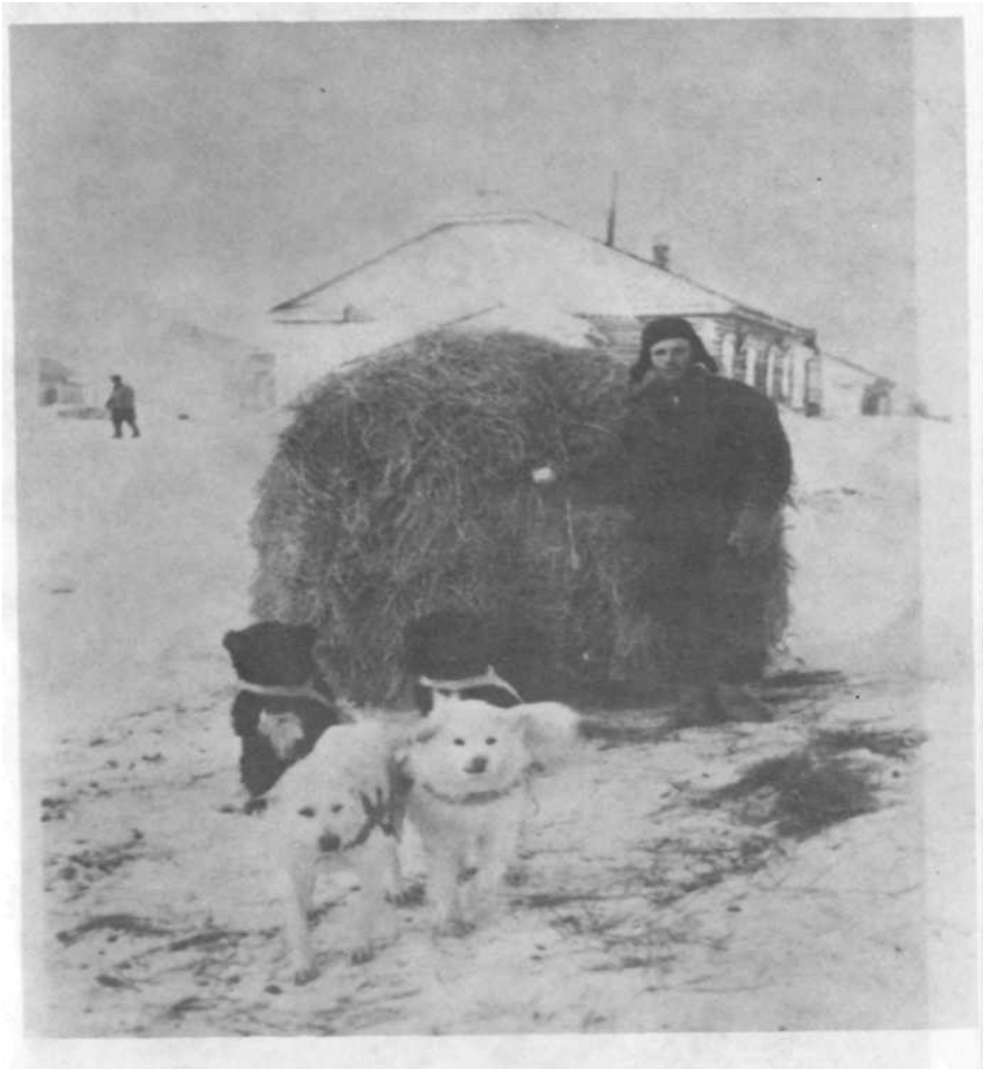
Toader lingă sania trasă de câini. Siberia, 1956.