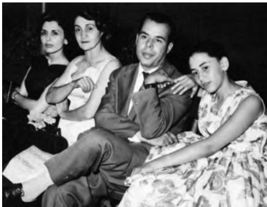
Mama, o prietenă de familie, tata și cu mine

— Să nu lași să se vadă nici o slăbiciune, nici un semn că suferi sau că îți e rușine! Nu ți-e rușine, nu-i așa? Astea sunt doar încercări ale rezistenței noastre. Acum chiar e momentul să fim mândri!