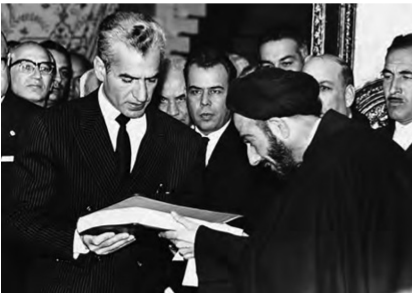
Tata, în spatele șahului, la întâlnirea cu un cleric

Tata se împăca bine cu mulți clerici, mai ales cu cei pe care îi considera progresiști. El a nesocotit „recomandarea“ prim-ministrului de a se ține deoparte și s-a dus la ceremonia de doliu ce a avut loc în casa mult respectatului ayatollah Behbehani, unde un tânăr cleric a făcut multe remarci denigratoare despre șah și guvernul său. Prim-ministrul i-a spus tatei că guvernul decisese să ia măsuri aspre împotriva protestatarilor și l-a sfătuit pe tata să nu se amestece. Îi sugerase că ar fi fost avantajos să se dea la fund și i-a poruncit să închidă magazinele pe 5 iunie, când Khomeini și adepții săi decisese să dezlănțuie proteste și demonstrații ample. Tata nu i-a luat ordinul în seamă și a hotărât să lase magazinele să deschidă mai devreme decât de obicei, în așa fel încât lumea să-și poată aduna provizii. A înființat și centre de urgență în diferite părți ale orașului ca să se ocupe de protestarii răniți.