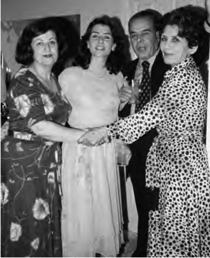
A doua zi după nuntă, 9 septembrie 1979. De la stânga: mama lui Bijan, eu, tata, mama