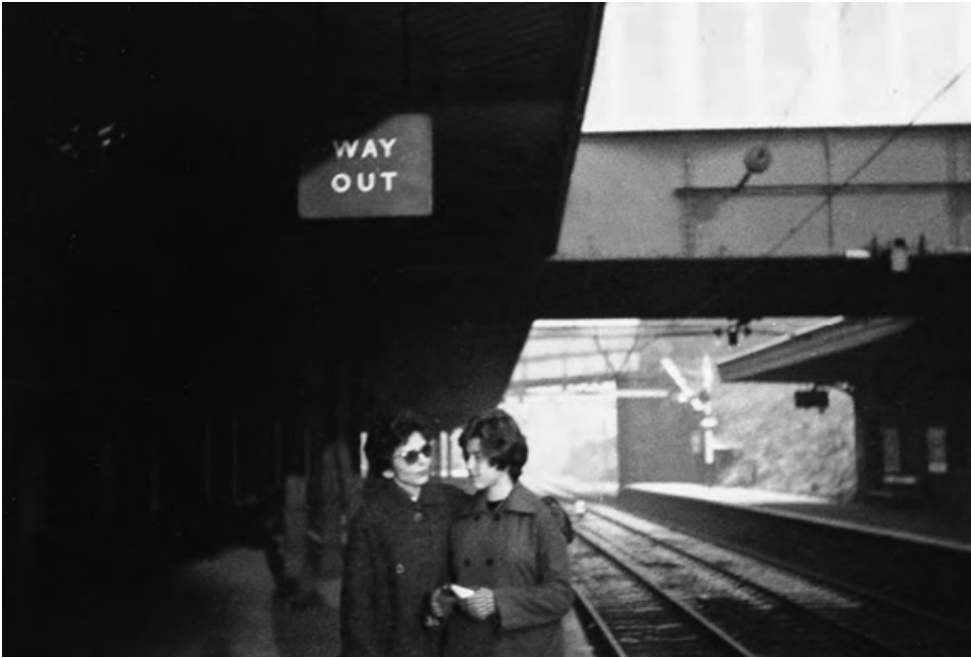
Mama și cu mine luându-ne rămas-bun în gara Lancaster, în decembrie

Ea a plecat din Lancaster într-o după-amiază, la începutul lui decembrie. Era o zi friguroasă și înnorată, după cum se vede și în fotografia noastră de pe peronul gării. Eu purtam un balonzaid maro de care eram amândouă foarte mândre, iar ea un pardesiu negru cu roșu. Ea se înclina ușor către mine, zâmbind. Deși nici una dintre noi nu ne uitam în obiectivul aparatului de fotografiat, se vede clar că eram conștiente de existența lui. Ea mă privea, ținând o mână pe spatele meu, de parcă m-ar fi apărat de ceva. Atât gestul, cât și expresia chipului ei sunt tipice pentru felul în care voia ea să apară în fotografii, unde te așteptai să radieze de căldură și iubire.