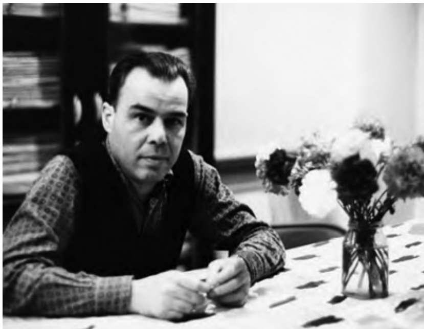
Tata în timpul prizonieratului

Ce ar trebui să facem însă e să aflăm adevăratul motiv pentru care se află la închisoare.