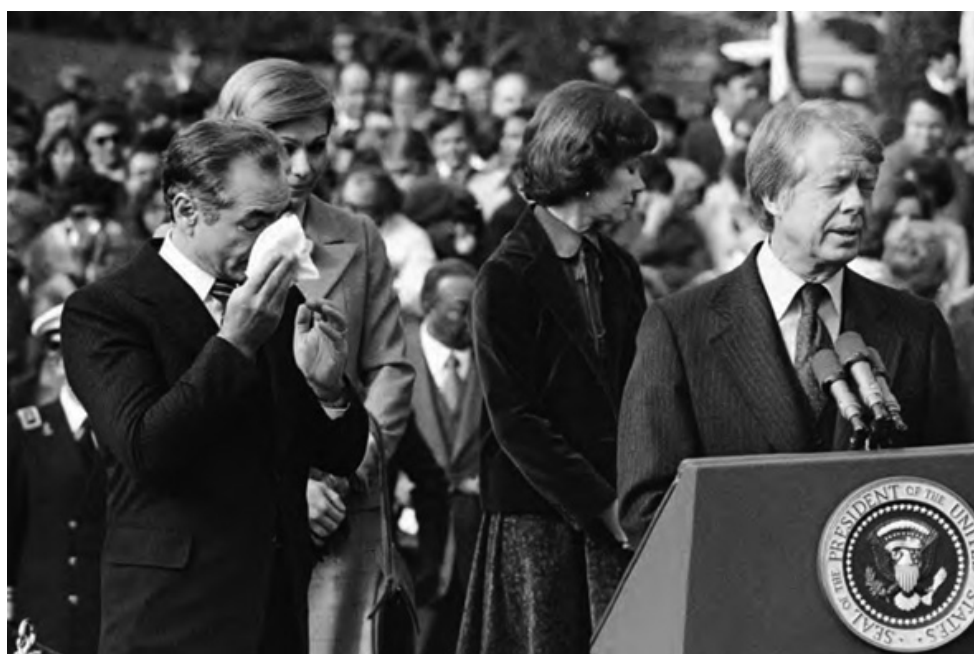
Șahul și președintele Carter la Casa Albă