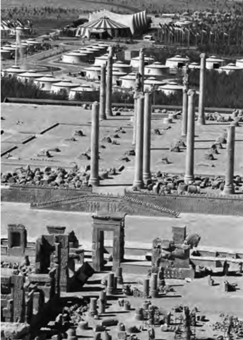
Corturi pentru sărbătorirea a 2500 de ani de existență a Persepolisului

La începutul anilor 1970, țara trecea printr-o situație paradoxală: se bucura de o înflorire economică datorată creșterii fără precedent a prețului petrolului (care avea să dea curând naștere unor numeroase probleme economice), dar era profund divizată de măsurile de liberalizare socială inițiate de șah. Și, în același timp, devenea tot mai polarizată și închisă din punct de vedere politic. Clasa de mijloc, care beneficiase cel mai mult de transformările politice și sociale, era ținută la distanță