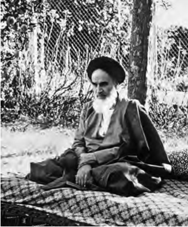
Ayatollahul Khomeini în exil la Paris