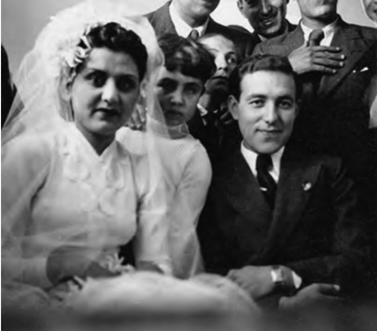
Nunta mamei cu Saifi

Am trei fotografii ale mamei cu Saifi. Două sunt de la nuntă, dar pe mine mă intrigă cea de a treia, mult mai mică, cu ei doi la un picnic, așezați pe o piatră. Amândoi se uită direct în obiectiv și zâmbesc. Ea se cuibărește lângă el cu degajarea celor ce sunt atât de apropiați, că nu au nevoie să se țină prea strâns în brațe. Trupurile lor par a se atrage firesc. Privind această poză, văd o femeie relaxată, care poate nu era încă frigidă.