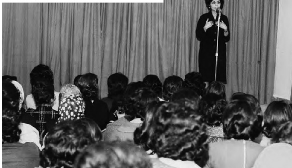
Mama când era parlamentar

Dar, așa cum se întâmplă în cele mai multe cazuri, mai era și o altă fațetă a poveștii. Mama trebuie că era măcinată de grija pentru soarta tatei. În ciuda refuzului ei încăpățânat de a se îngriji pentru el, era permanent neliniștită de toate nenorocirile imaginare care puteau să se abată asupra mea și a