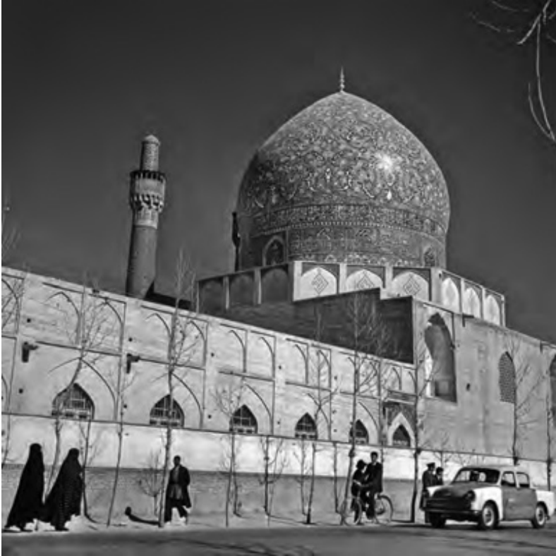
Madrasa Chahar Bagh, Isfahan