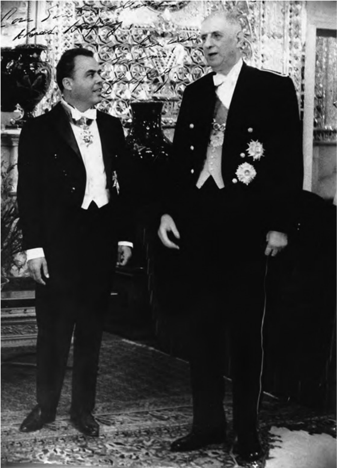
Tata împreună cu Președintele Franței, Charles de Gaulle