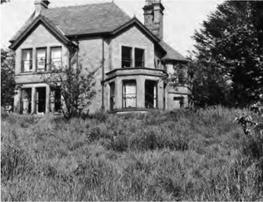
Scotforth House, în Lancaster

atunci se ținea de acel lucru cu o energie și concentrare uimitoare.