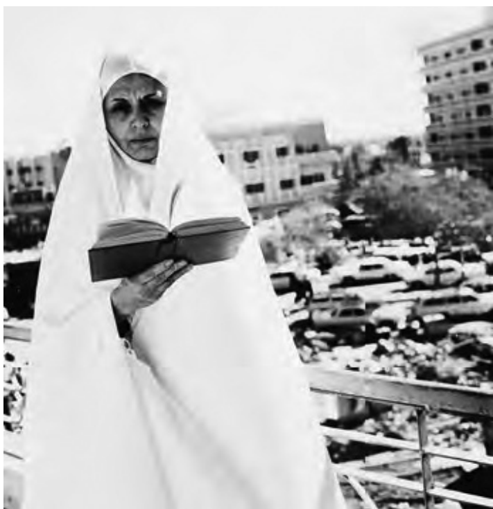
Mama în pelerinaj la Mecca, la mijlocul anilor 1970

considerau că nu era momentul să luptăm pentru astfel de chestiuni lipsite de importanță, când se puneau problema independenței și luptei antiimperialiste. Într-o dimineață absolut memorabilă, Shirin Khanoom a ridicat problema „islamului autentic“. S-a afirmat că ayatollahul Khomeini reprezenta adevărata credință ( Eslam-e rastin ), în timp ce șahul și oponentii lui Khomeini adoptau o versiune falsă, „islamul american“. Asta a înfuriat-o pe mama.