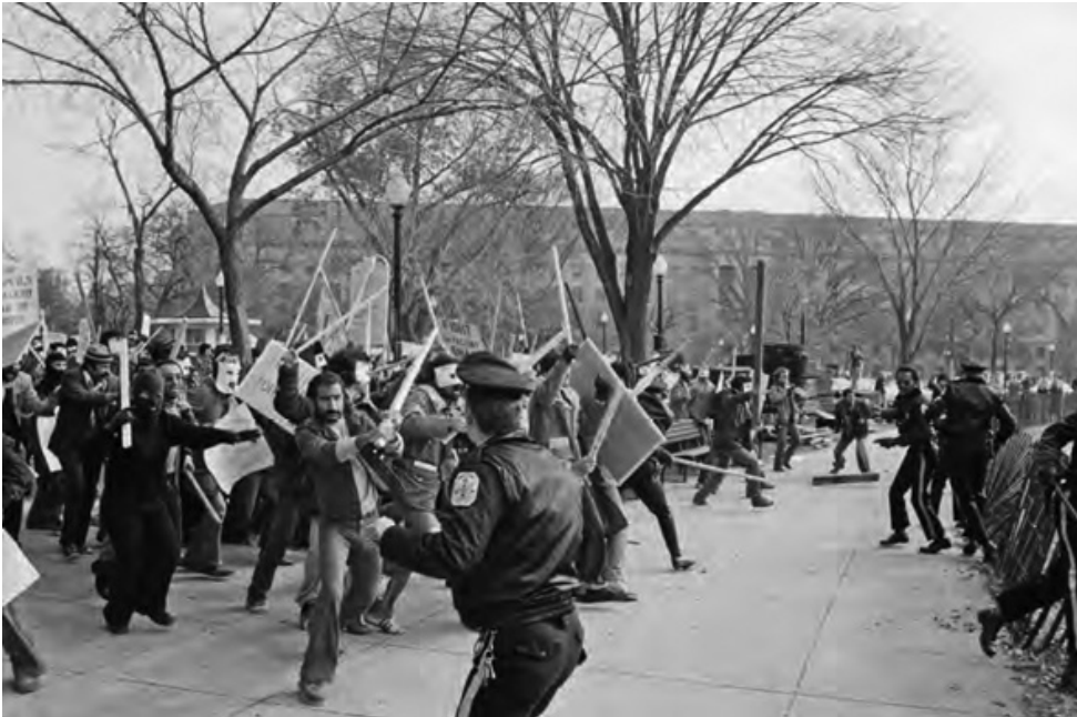
Demonstrații de protest împotriva șahului, lângă Casa Albă