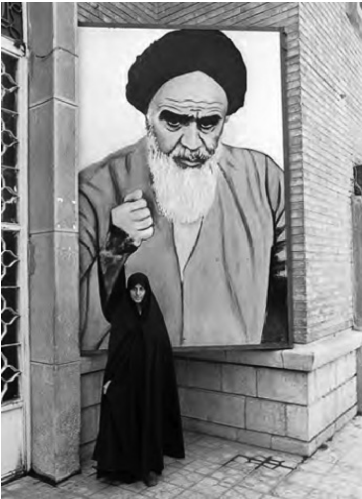
O iraniancă cu un afiș propagandistic reprezentându-l pe Khomeini