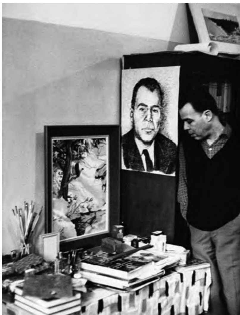
Tata în închisoare, alături de unul dintre tablourile sale cu păsări

a dragostei pentru familie și prieteni, este imensa lui dragoste de viață. De parcă închisoarea i-ar fi distilat toată dragostea în clipe de intensitate maximă, așa că se apucă să învețe limbi străine, scrie și citește, cu-getă asupra istoriei, pictează și slăbește aproape zece kilograme.