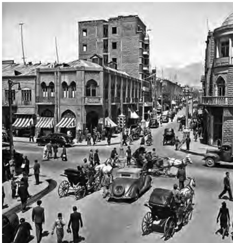
Intersecția bulevardului Lalehzar cu strada Istanbul, în anii 1940

piele. Mama și cu mine intram și ieșeam din magazine aglomerate de lenjerie, de metraje sau de marochinărie. În fiecare dintre ele, schimba amabilități și bârfele cu patronii în timp ce eu umblam prin magazin, băgându-mi nasul în încăperile din spate, curioasă să zăresc atelierelor unde bucățile de materiale și de piele erau transformate în sutiene, capoate, pantofi și poșete.