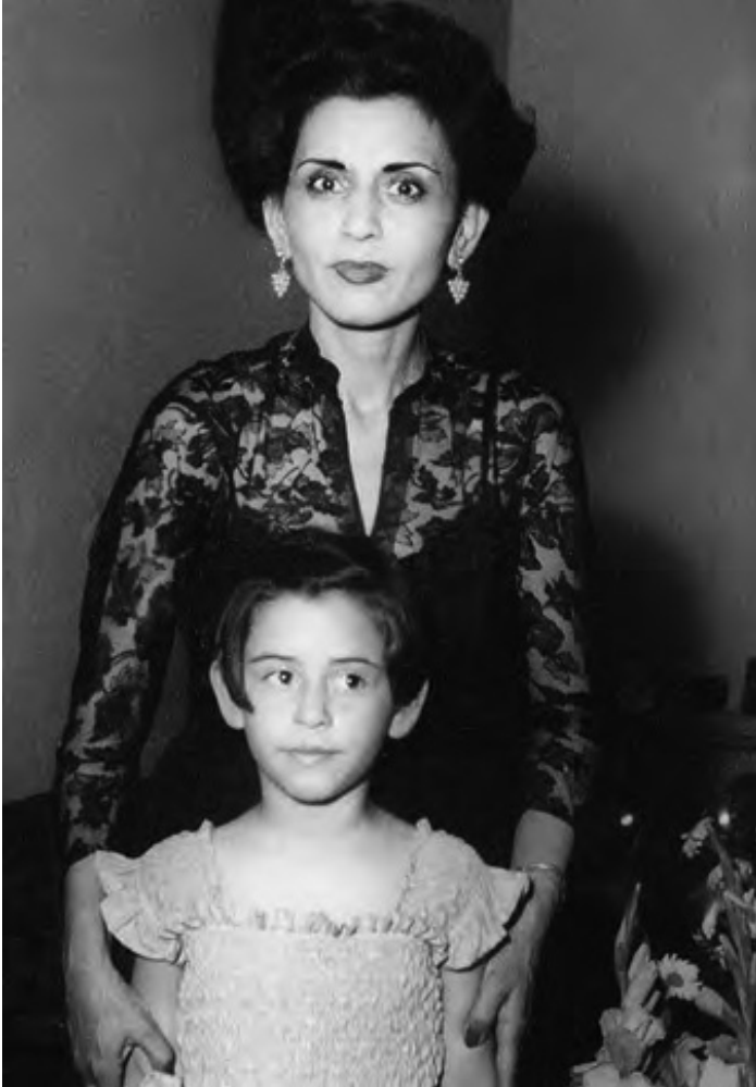
Eu și mama la nunta unei rude