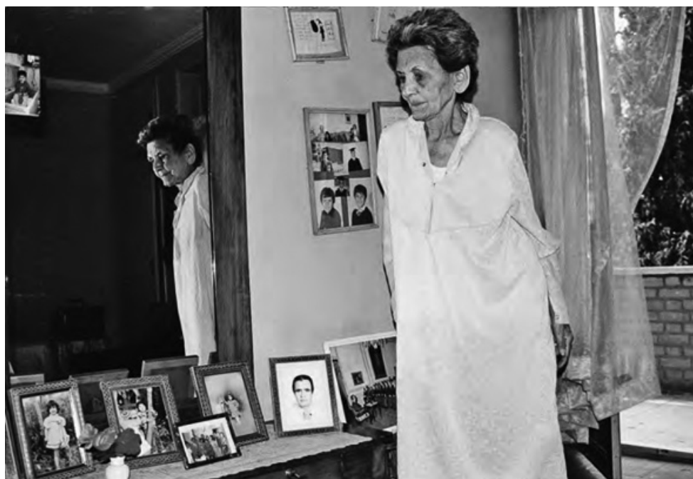
Mama către sfârșitul vieții, printre fotografiile ei

În ultima parte a vieții, mama își petrecea majoritatea timpului într-un salon lângă dormitor. Încăperea era deprimantă pentru mine, deși era însorită, cu uși mari, cu geamuri până jos, care se deschideau într-un balcon ce dădea spre grădină. Această luminozitate veselă era umbrită de fotografiile care păreau că se înmulțesc alarmant pe mese, pe orice suprafață la îndemână și pe pereți. Erau aranjate fără a se ține seama de mărime sau formă și aproape nici una nu atârna drept, stăteau înclinate una spre alta, asemenea unor străini beți într-un bar.