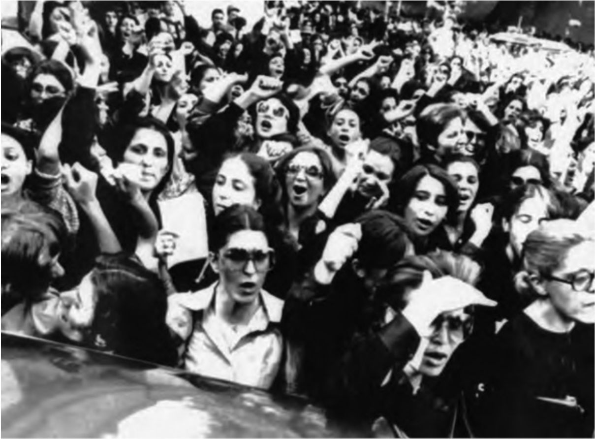
Femei protestând împotriva ținutei vestimentare islamice în 1980